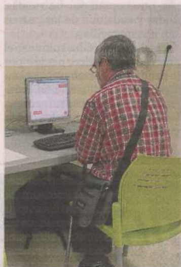
Participantes en el Pimei. ATADI

Atadi gestiona una nueva edición del Programa Integral para la Mejora de la Empleabilidad y la Inserción (Pimei), en la provincia de Teruel. El objetivo es la inserción laboral de personas con especiales dificultades para acceder a un empleo, para lo que se ofrece orientación y el desarrollo de habilidades necesarias para conseguir un puesto de trabajo, con el fin de incrementar sus posibilidades en el mercado laboral. El programa gestionado por Atadi se centra en conseguir oportunidades laborales para personas con discapacidad.