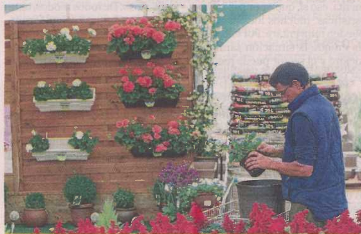
El empleo es la puerta de entrada a la inclusión social. P.I.

Este programa sirve para ayudar a las personas con discapacidad intelectual o del desarrollo a encontrar trabajo y a mantenerlo.