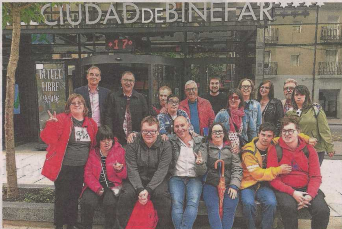
Imagen de archivo de un acto celebrado en Binéfar por los usuarios de Down Huesca.

El fin de este proyecto –denominado ‘Educación permanente de las personas con síndrome de Down o con otras discapacidades intelectuales: Innovación e inclusión en el medio rural’ y en el que participan tres socios: Association-Trisomie 21 Pyrénées-Atlantiques de Pau (Francia), Primavera Società Cooperativa Sociale de Geraci Siculo (Italia) y Asociación Las Cañas de Alcañiz– es impulsar, innovar e indagar acciones formativas en las poblaciones que les permitan adquirir, actualizar o ampliar sus competencias para su desarrollo personal, social y pro-