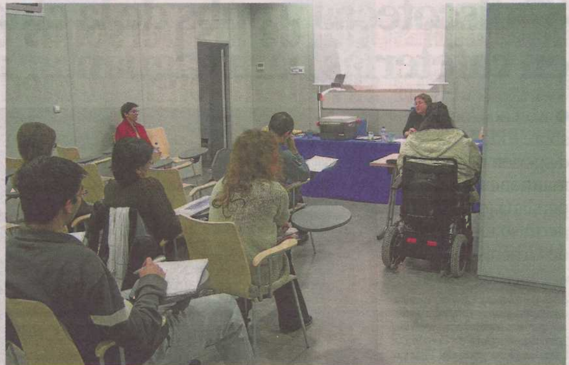
Una anterior edición del seminario en el centro Joaquín Roncal CAI. DISCAPACITADOS SIN FRONTERAS

El objetivo es dar una visión lo más integral posible de las personas con discapacidad. Por ello, se tratarán temas como la sexualidad, qué beneficios conlleva la música y la danza o cómo ha evolucionado la imagen social de la discapacidad en la sociedad o a través del cine.